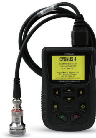
측정 및 설정시 : 전면 LCD